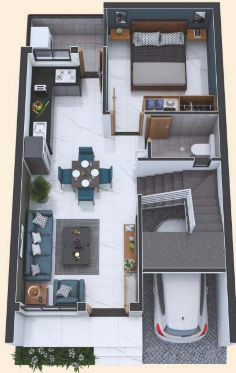
Ground Floor Plan | Size : 18' x 31'